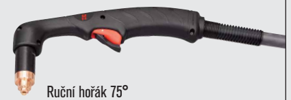
Ruční hořák 75°

(více volitelných možností hořáku viz www.hypertherm.com )