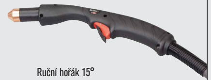
Ruční hořák 15°